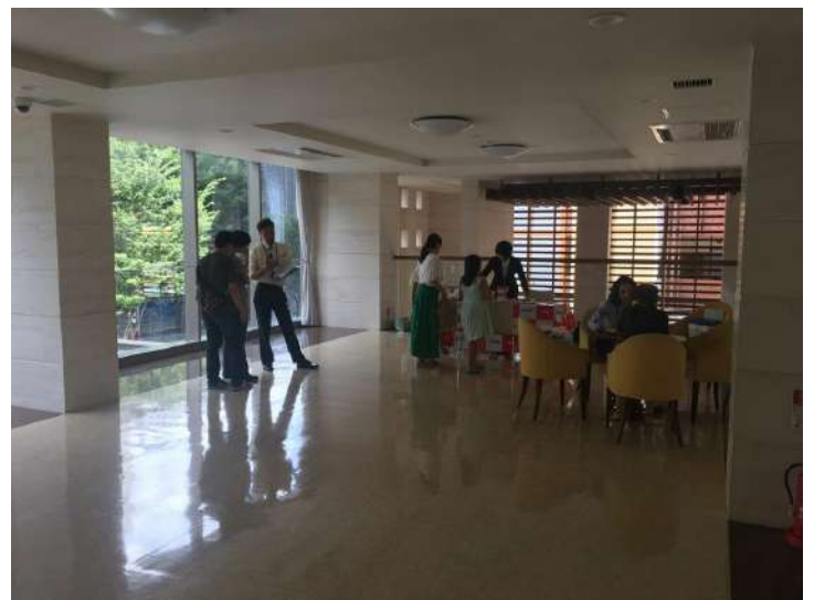
上の写真は、大型オートロックマンション