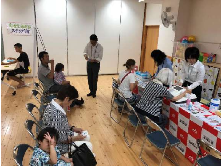
上の写真は、幼稚園納涼祭