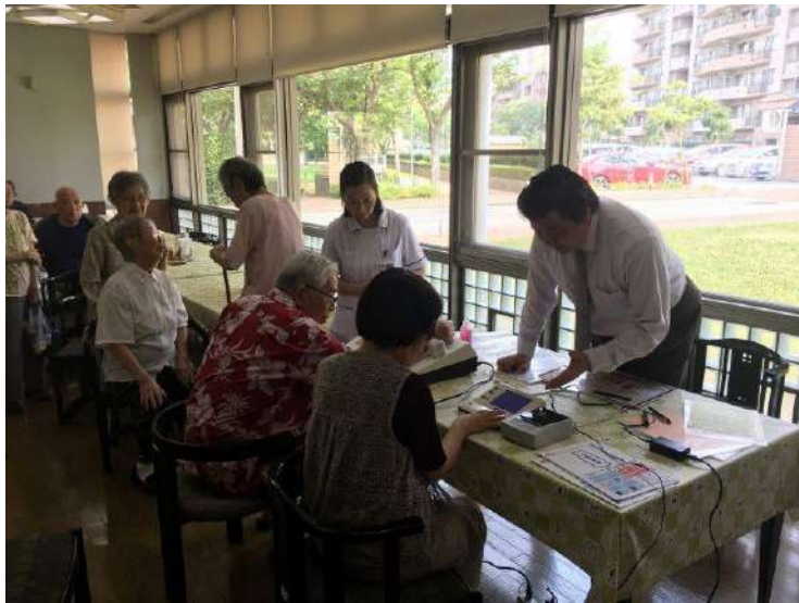
上の写真は、サービス付きシニアマンション