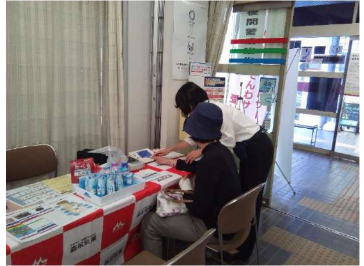
上の写真は、郵便局